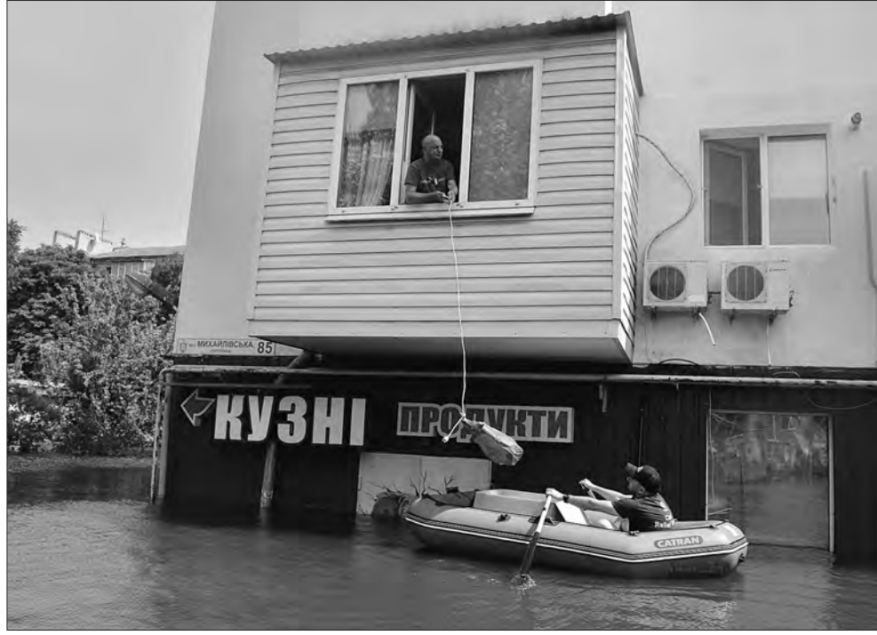
Волонтери передають продукти людям, які залишилися в затоплених будинках.