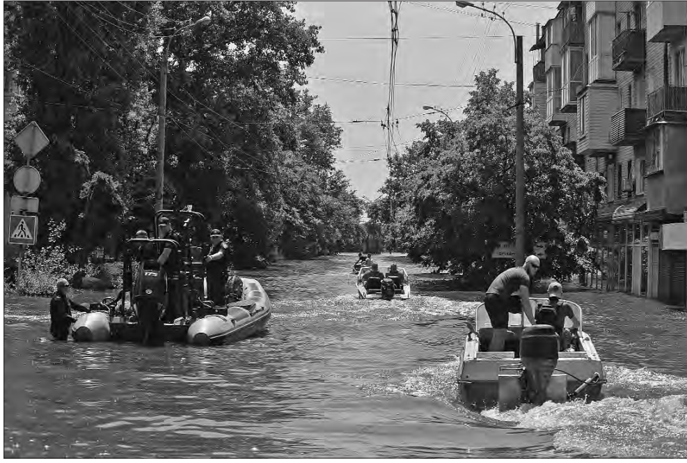
Волонтери плвуть евакуювати людей та тварин.