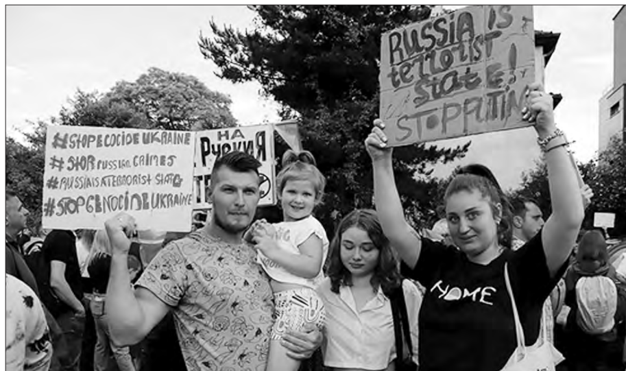
Болгарські учасники акції протесту прийшли разом із дітьми.

На прийомі, де лилася дармова горілка, «болгарські гості» демонстративно фотографувалися з послом країни-агресора, а потім викладали ці знімки в