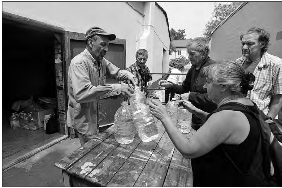
Люди отримують безплатну воду від волонтерів.